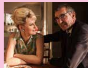
Kjell Bergqvist vann en Guldbagge för Den bästa sommaren och Bröllopsfotografen . Nu är han aktuell i Monica Z .