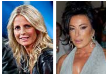
Svennis relation med Ulrika Jonsson och Nancy Dell'Olio har skapat många tidningsrubriker genom åren.