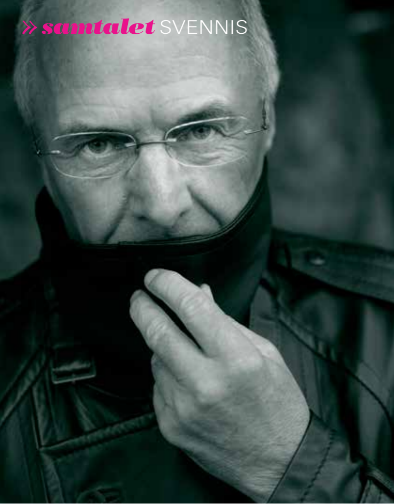
BLICKAR FRAMÅT. Svennis gillar inte att titta i backspegeln. "Åker du på en smäll kan du välja om du ska ligga kvar eller om du ska resa dig. Jag har alltid rest mig och sett framåt."